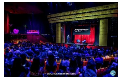
1ª edición de AEVEA&CO en 2016.